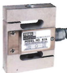
Рисунок 1 – Внешний вид семейства 614

Внешний вид семейств датчиков показан на рисунках 1 – 7.