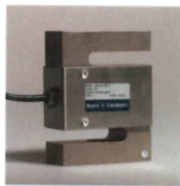
Рисунок 6 – Внешний вид семейства 363