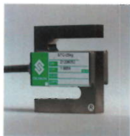
Рисунок 4 – Внешний вид семейства STC