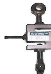
Рисунок 7 – Внешний вид семейства 9363