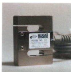
Рисунок 2 – Внешний вид семейства 615