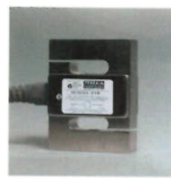
Рисунок 3 – Внешний вид семейства 616